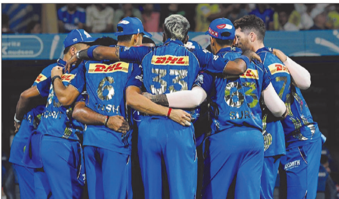
भी उसे नुकसान हुआ है। उसे इस सत्र में प्लेऑफ के लिए अब कम से कम 14 अंकों की जरूरत है। इसके अलावा उसे अपने रनरेट में भी सुधार करना होगा।

मुम्बई (एजेंसी)। मुम्बई इंडियंस आईपीएल के 19 वें सत्र में अबतक अच्छे प्रदर्शन नहीं कर पायी है और उसे 8 में से 6 मैचों में हार का सामना करना पड़ा है। इससे मुम्बई के प्लेऑफ में पहुंचने की संभावनाएं काफी कम हो गयी हैं हालांकि ये समास नहीं हुई है। प्लेऑफ के लिए अब मुम्बई को बच हुए सभी 6 मैच जीतने होंगे। इसमें अगर वह सफल रही तो उसे उसके 16 अंक हो जाएंगे और उसके लिए प्लेऑफ की राह खुली रहेगी। अभी टीम 4 अंक के साथ ही 9वें स्थान पर है। टीम को लीग स्तर पर अभी 6 मैच और खेलने हैं। उसका रेट में भी काफी कम है जिससे