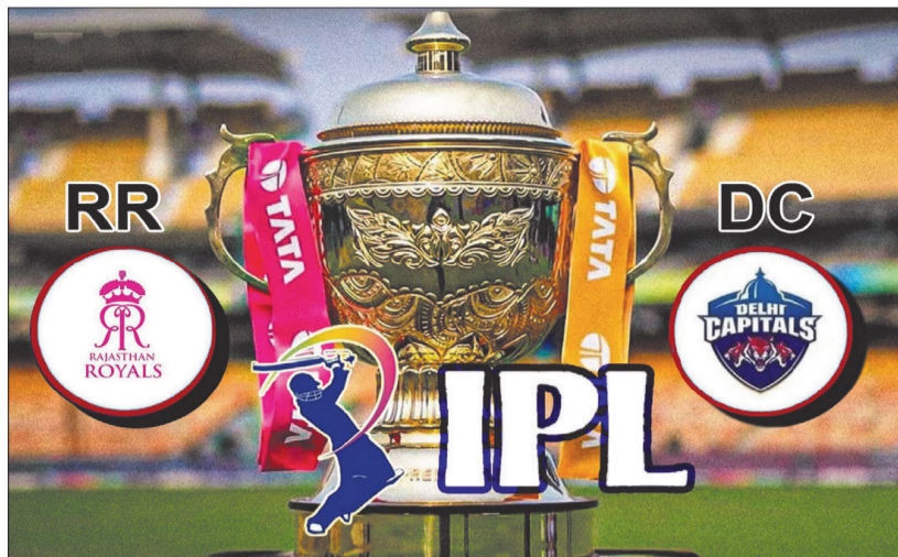
आंकड़ों पर नजर डालें तो अब तक दोनों टीमों के बीच 29 मैच हुए हैं इसमें से राजस्थान ने 15 जबकि दिल्ली ने 14 जीते हैं।

उसके लिए राहत की बात केवल इतनी सी है कि तेज गेंदबाज मिचेल स्टार्क फिट हो गये हैं और वह वापसी के लिए तैयार हैं। स्टार्क अगर खेलते हैं तो दिल्ली की गेंदबाजी मजबूत होगी। इसके अलावा वह लुंगी एनगिडी एंटीगिटी के नहीं खेलने से होने वाली कमी भी भर देंगे। एंटीगिटी चोटिल होने के कारण इस मैच में नहीं खेलेंगे।