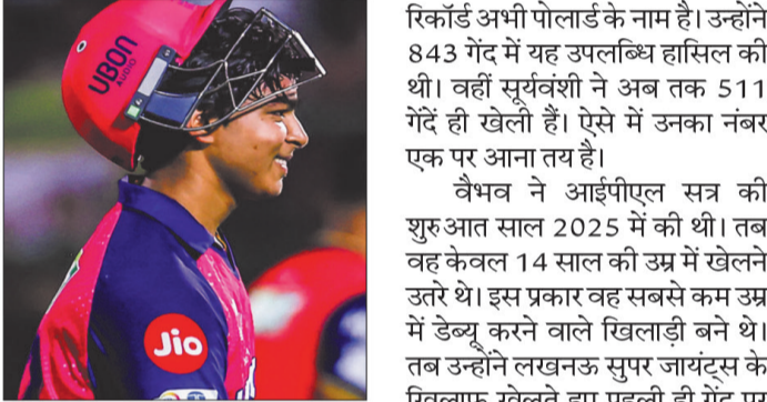
उन्के अब टी20 की 27 पारियों में कुल 99 छक्के हो गए हैं। टी20 में सबसे तेज 100 छक्के लगाने का विश्व

रिंकार्ड अभी पोलार्ड के नाम है। उन्होंने 843 गेंद में यह उपलब्धि हासिल की थी। वहीं सूर्यवंशी ने अब तक 511 गेंद ही खेली हैं। ऐसे में उनका नंबर एक पर आना तय है। वैभव ने आईपीएल सत्र की शुरूआत साल 2025 में की थी। तब वह केवल 14 साल की उम्र में खेलने उतरे थे। इस प्रकार वह सबसे कम उम्र में डेब्यू करने वाले खिलाड़ी बने थे। तब उन्होंने लखनऊ सुपर जायंट्स के खिलाफ खेलते हुए पहली ही गेंद पर छक्का लगाया था। वहीं इस सत्र में उन्होंने जसप्रीत नुमार और पैट कर्मिस जैसे गेंदबाजों पर भी छक्के